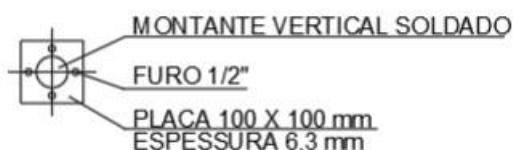
Figura 5: Detalhe fixação

A fixação do conjunto guarda-corpo e corrimão no piso se dará através de chapa de aço e chumbador. A chapa de aço terá espessura de 6.3mm e dimensões de 100 x 100 mm. Os chumbadores serão parafusos de 3/8" de diâmetro e 100 mm de comprimento.