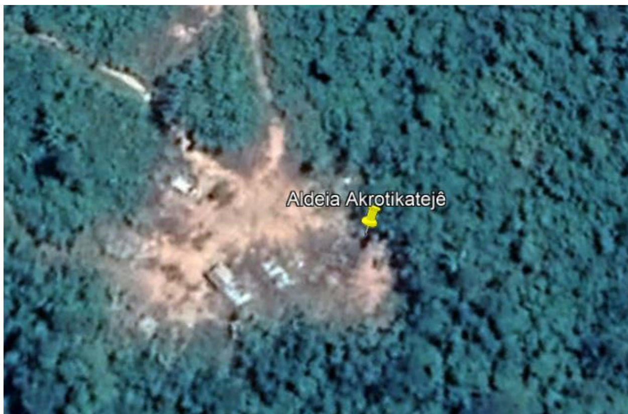
Figura 1 Aldeia vista aérea.

O presente memorial tem por finalidade descrever os serviços que serão que compõem o escopo para a implantação do Sistema de Abastecimento Coletivo de Água da Aldeia Akrotikatejê, localizada no município de Bom Jesus do Tocantins - PA, pertencente ao polo base de Marabá-PA.